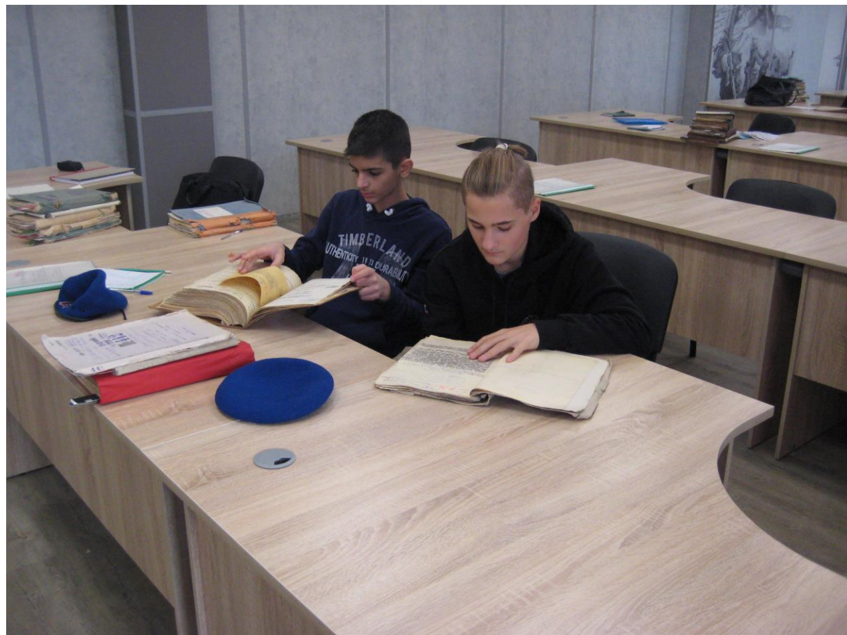
В читальном зале ЦАМО в Подольске. Работа с документами