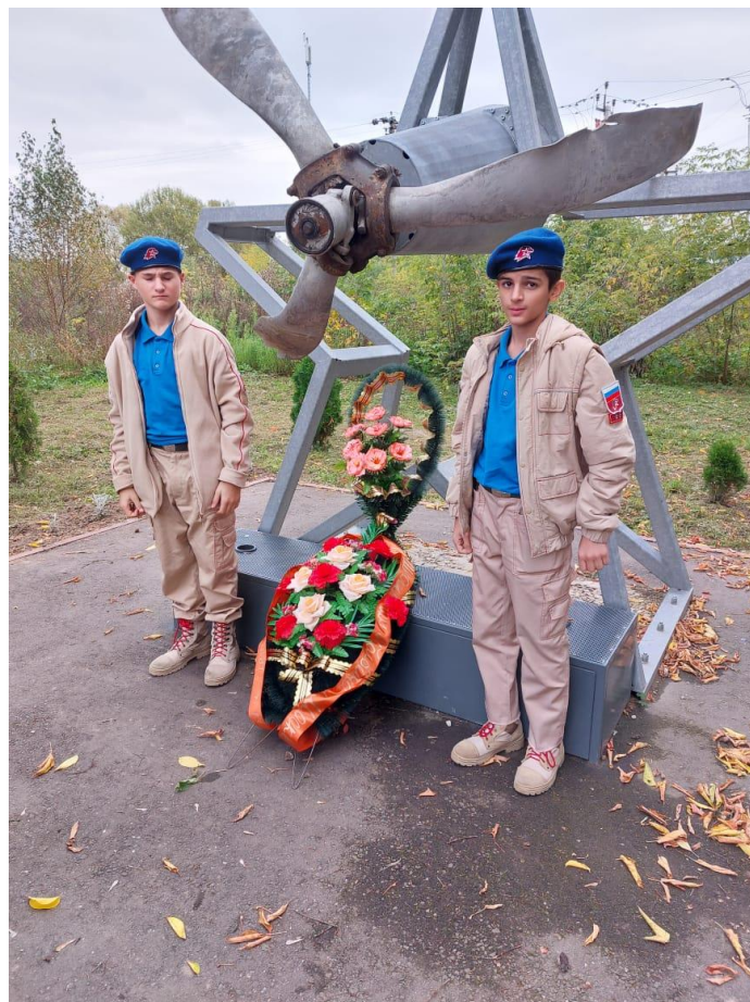
У Мемориала лётчикам, погибшим в битве за Москву